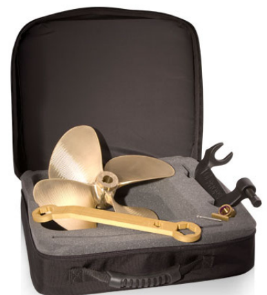
JUST-IN-CASE PROP KIT

La clé d'hélice de OJ, conçue spécifiquement pour retirer les écrous d'hélice sur les bateaux de compétition, est usinée avec précision en aluminium et anodisée.