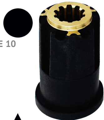
KIT MOYEU SÉRIE 10 40 À 75 CV